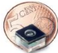
Grootte van een lens in mobiele telefoon