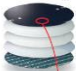
'Wafer' met 4.200 lensjes

Productie van mini-objectieven met behulp van technieken uit de chipindustrie